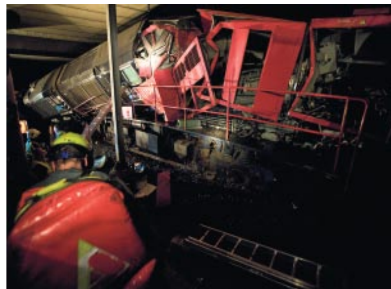
De treinbotsing in Barendrecht, september 2009